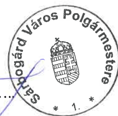
Dr. Sükösd Tamás Polgármester